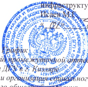
График организации повторной (комиссионной) промежуточной аттестации обучающихся филиала ДГУ в г. Кизляре специальности 40.02.01 «Право и организация социального обеспечения» на базе среднего общего образования Форма обучения: заочная 2023 - 2024 учебный год