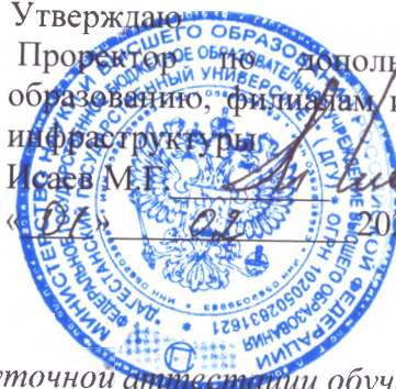
График организации повторной (комиссионной) промежуточной аттестации обучающихся филиала ДГУ в г. Кизляре специальности 40.02.01 «Право и организация социального обеспечения» на базе среднего общего образования форма обучения: очная 2023 - 2024 учебный год