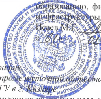
График организации повторной (комиссионной) промежуточной аттестации обучающихся филиала ДГУ в г. Кизляре специальности 40.02.01 «Право и организация социального обеспечения» на базе основного общего образования форма обучения: заочная 2023 - 2024 учебный год